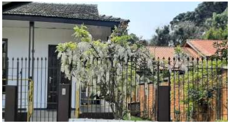
Glicíneas brancas e botoes de rosas cuidadas pelo Tio Dê