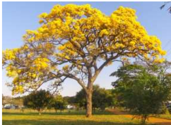
IPÊ AMARELO – ÁRVORE SÍMBOLO DO BRASIL